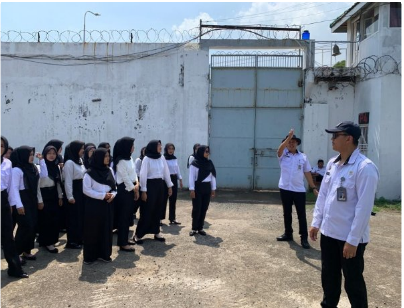
Lapas Pekalongan Gelar Pengenalan Lingkungan bagi 31 Peserta Magang, Bekal Awal pahami dinamika Pemasyarakatan

ota Pekalongan — Lapas Kelas IIA Pekalongan menggelar kegiatan Pengenalan Lingkungan bagi 31 peserta magang. Agenda ini menjadi langkah awal orientasi untuk memastikan para peserta benar-benar memahami kondisi, fungsi, serta